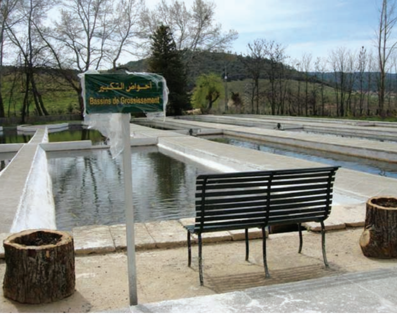
احد أحواض تربية أسماك التروتة