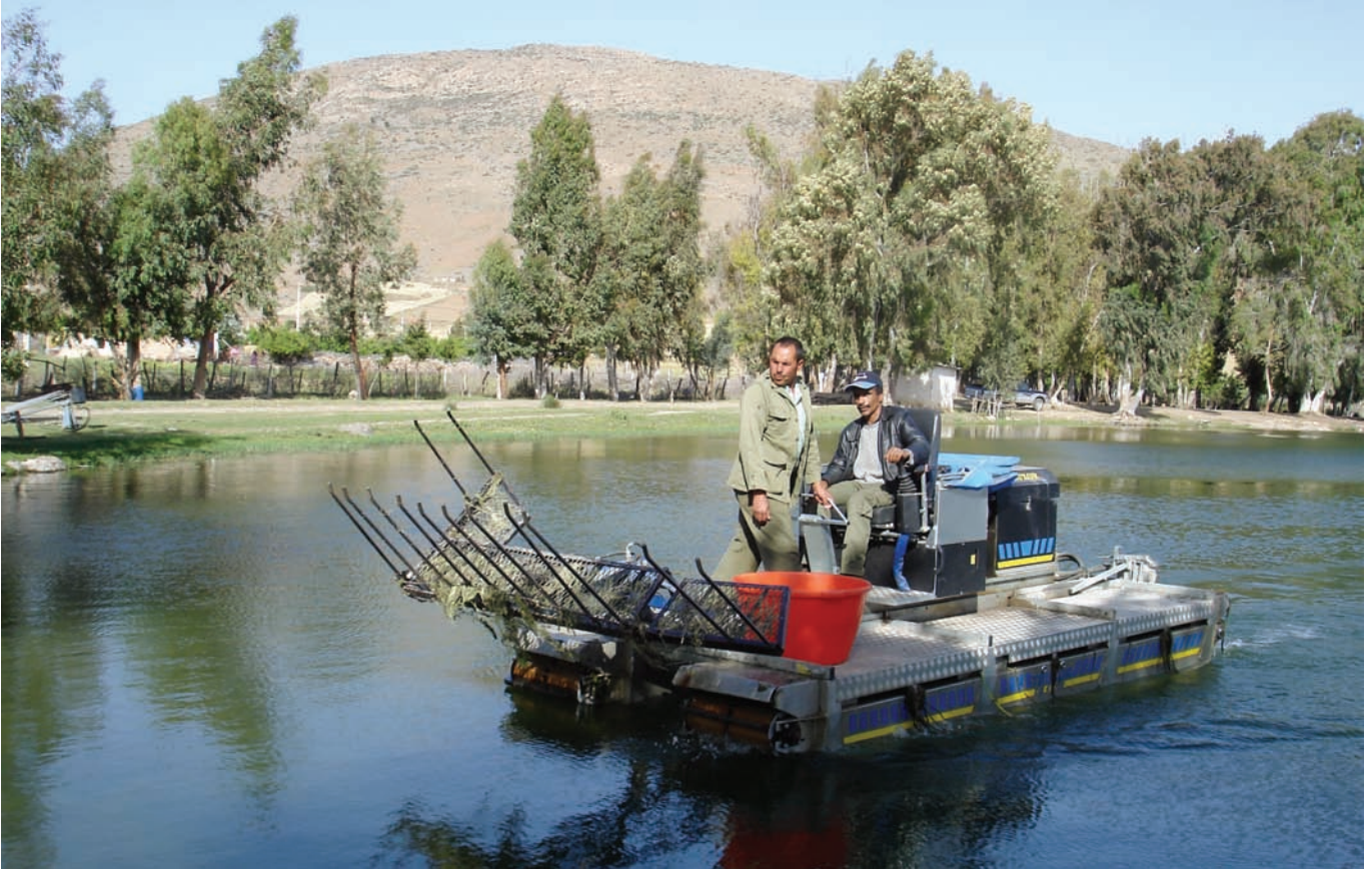
تنقية البحيرة من الطحالب

زيارة الى بحيرة رأس الماء حيث تربي الأسماك ويمارس الصيد الرياضي المنظم