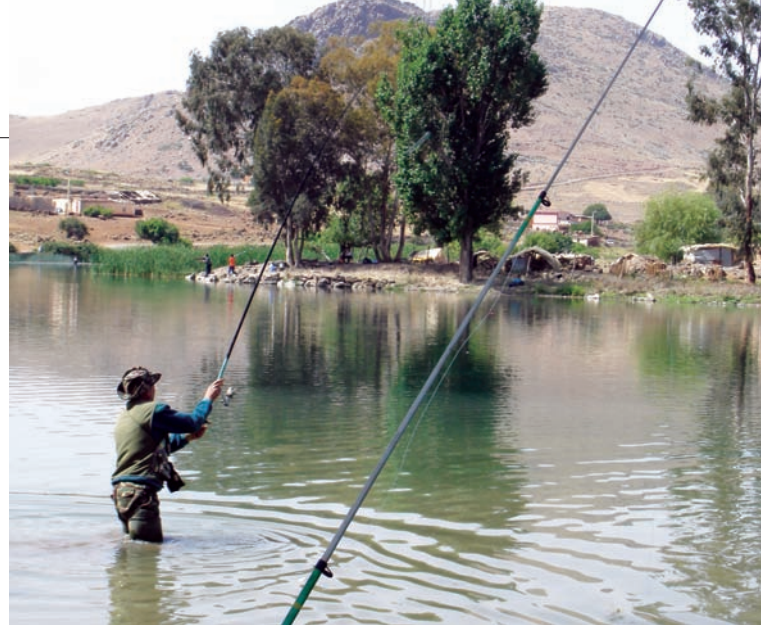
صيد في البحيرة