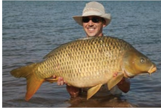
سمكة الفرخ الأسود